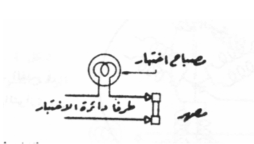
اختبار المصهر خارج دائرة المحرك

نتيجة إرتفاع درجة حرارة المحرك ويمكن الكشف لإحتراق المصهر عن طريق مصباح إختبار يوصل كما في الشكل التالي